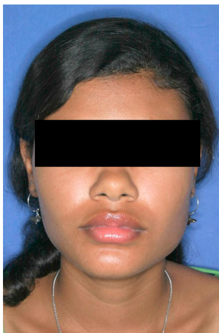
Figura 5. Avaliação pré-operatória (Vista frontal) – Observa-se aumento de volume em região de ângulo mandibular bilateral, com volume massetérico maior em lado direito.

Paciente 18 anos, gênero feminino, compareceu ao Serviço de Cirurgia e Traumatologia Bucomaxilofacial das Obras Sociais Irmã Dulce, com queixa de face larga e aumento de volume bilateral da face. História da doença atual, exames físico e radiográfico semelhantes ao da primeira paciente, exceto pelo fato de possuir assimetria facial, com um maior volume massetérico do lado direito (Figura 5).