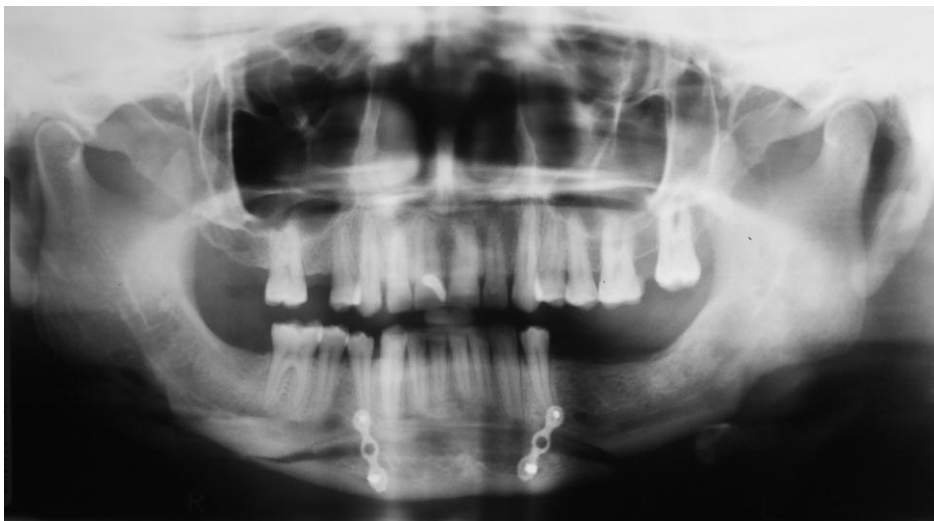
Figura 3. Radiografia panorâmica – Aspecto radiográfico pós-operatório: observa-se área de osteotomia e osteotomia do mento

A cirurgia foi realizada após três meses da primeira intervenção, sob anestesia geral. O acesso foi realizado em fundo de sulco vestibular de maneira convencional, como nas osteotomias basilares do mento. Após a osteotomia realizou-se a reposição inferior do mento de 05 mm, com interposição de enxerto ósseo proveniente da crista ilíaca (Figura 3).