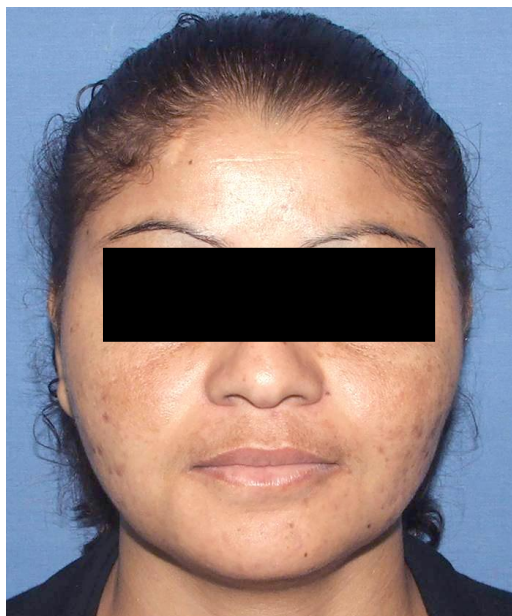
Figura 4. Pós-operatório 12 meses: Observa-se diminuição de volume em região de ângulo mandibular bilateral, com aumento vertical da face.

A paciente evoluiu assim com melhora do contorno e proporção facial, estando no momento com 12 meses de acompanhamento e sem queixas de qualquer espécie (Figura 4).